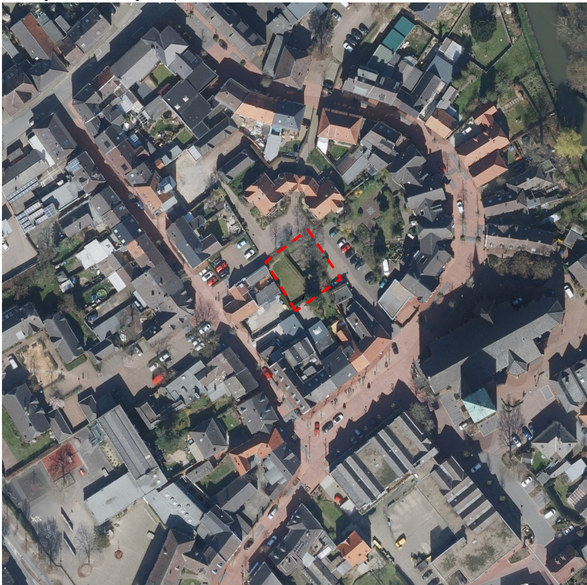
Abbildung: Luftbild des Plangebiets

Die nähere Umgebung ist überwiegend durch Wohnbebauung und Gemeinbedarfseinrichtungen geprägt. Rund 100 m östlich verläuft die Niers.