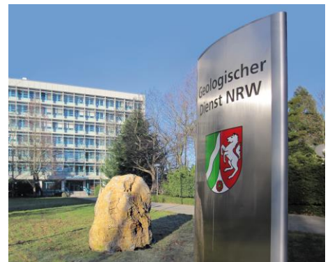
Geologischer Dienst NRW in Krefeld

Im Rahmen der Bodenuntersuchungen führen die Mitarbeiter*innen des Geologischen Dienstes NRW Sondierungen (Handbohrungen) bis maximal 2 m Tiefe durch. Stellenweise werden auch Aufgrabungen angelegt, aus denen Bodenproben entnommen werden.