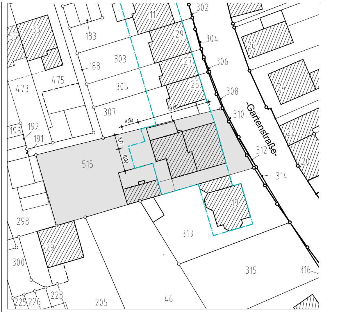
Auszug aus dem bestehenden Bebauungsplan (19. Vereinfachte Änderung)

Der Bebauungsplan sieht folgende Festsetzungen vor: Es ist ein allgemeines Wohngebiet mit einer Grundflächenzahl von 0,4 und einer Geschossflächenzahl von 0,8 ausgewiesen. Weiterhin ist eine geschlossene Bauweise mit zweigeschossiger Bebauung vorgesehen.