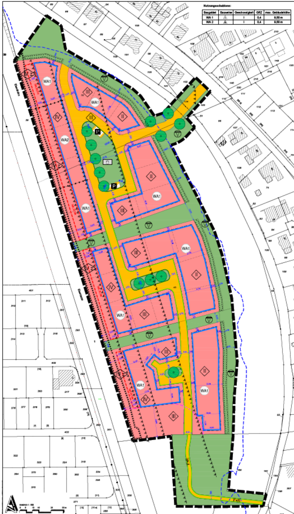
Abbildung 1: Planzeichnung des rechtskräftigen Bebauungsplanes Weeze Nr. 36 - Phillipsen Wiesen