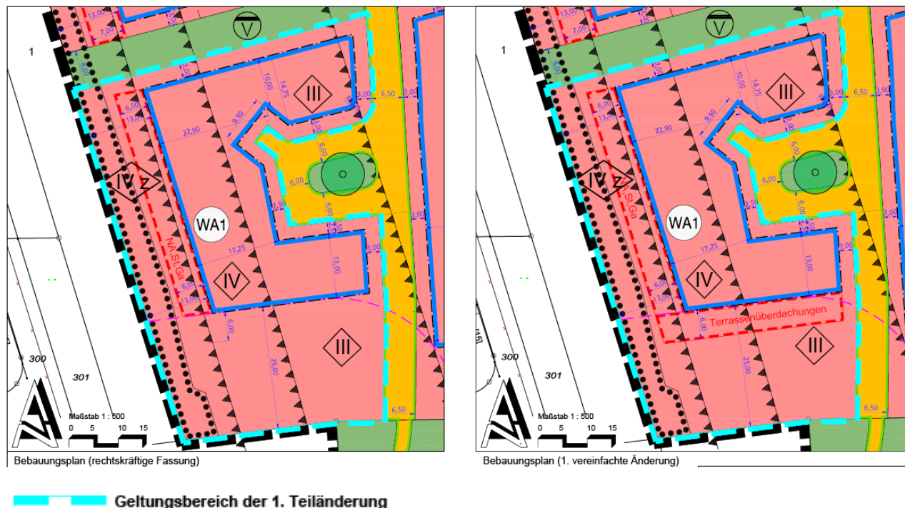
Abbildung 3: Geltungsbereich der 1. vereinfachten Änderung und Gegenüberstellung der Planzeichnung des Bebauungsplanes Weeze Nr. 36 –Phillipsen Wiesen– (links) und der 1. vereinfachten Teiländerung (rechts).

Die Errichtung von Wintergärten oder sonstigen für den dauerhaften Aufenthalt von Menschen geeigneten Gebäudeteilen oder Bauwerken ist ausdrücklich nicht zulässig.