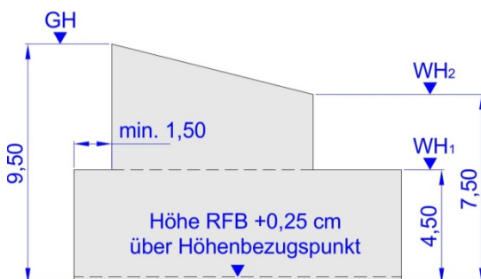
Abbildung: Zuordnung Höhenangaben.