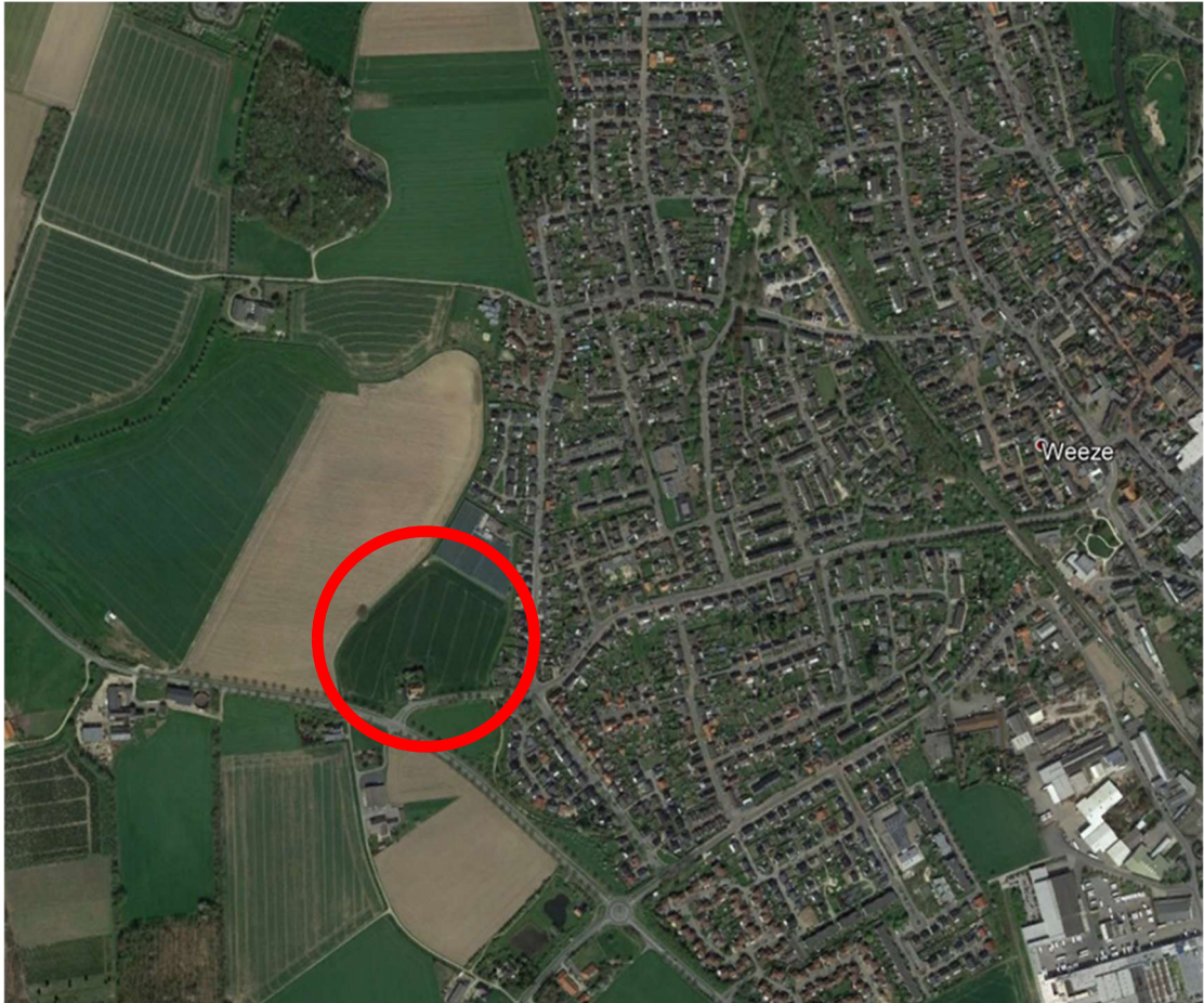
Abbildung 1: Lage des Plangebietes in der Gemeinde Weeze

Durch den Bebauungsplan wird die planungsrechtliche Grundlage für ein neues Wohngebiet geschaffen. Die Lage des Plangebietes ist nachfolgend in Abbildung 1 dargestellt.